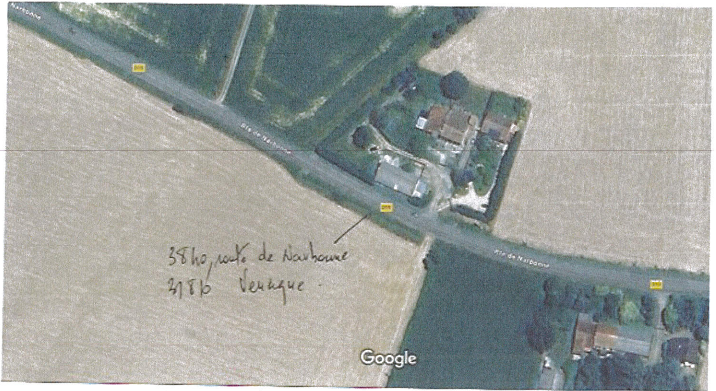
Images ©2024 Airbus, Maxar Technologies, Données cartographiques ©2024 20 m